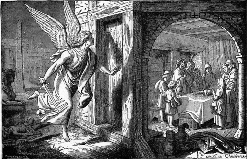
The Angel of Death and the First Passover