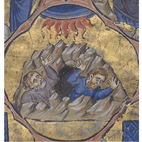
Korah's Fate Bible abrégée