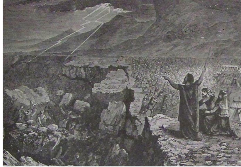
Destruction of Korah, Dathan, and Abiram Holman Bible